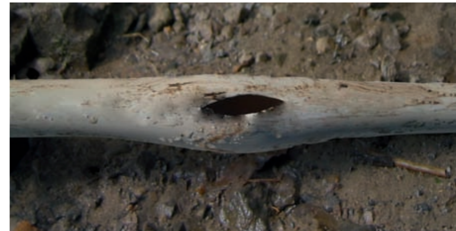
Undichte Abwasserleitung können zu erheblichen Schäden an Ihrer Bausubstanz führen. Nicht selten begegnen unseren Fachleuten Risse, wie bei diesem PVC-Rohr.

Im Falle einer erforderlichen Sanierung bekommen Sie keine öffentlichen Zuschüsse. Allerdings gibt es einige angepasste Kredit-Angebote der Banken. Bitte fragen Sie auch Ihre Hausbank nach günstigen Krediten und vergleichen Sie dabei immer mehrere Angebote. Die KfW-Bankengruppe fördert die Dichtheitsprüfung und die Sanierung des Abwasserkanals auf dem eigenen Grundstück. Den Kredit-Antrag, der unbedingt vor Beginn der Arbeiten gestellt werden muss , stellen Sie ausschließlich über Ihre Hausbank.